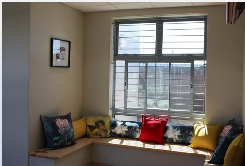
The Bench of Hope