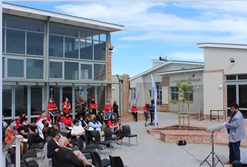
Guests seated in the amphitheatre